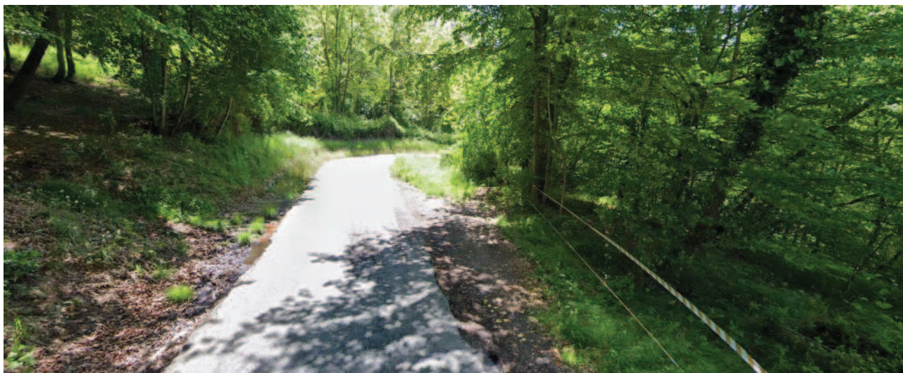
Viabilità inferiore ANTE evento