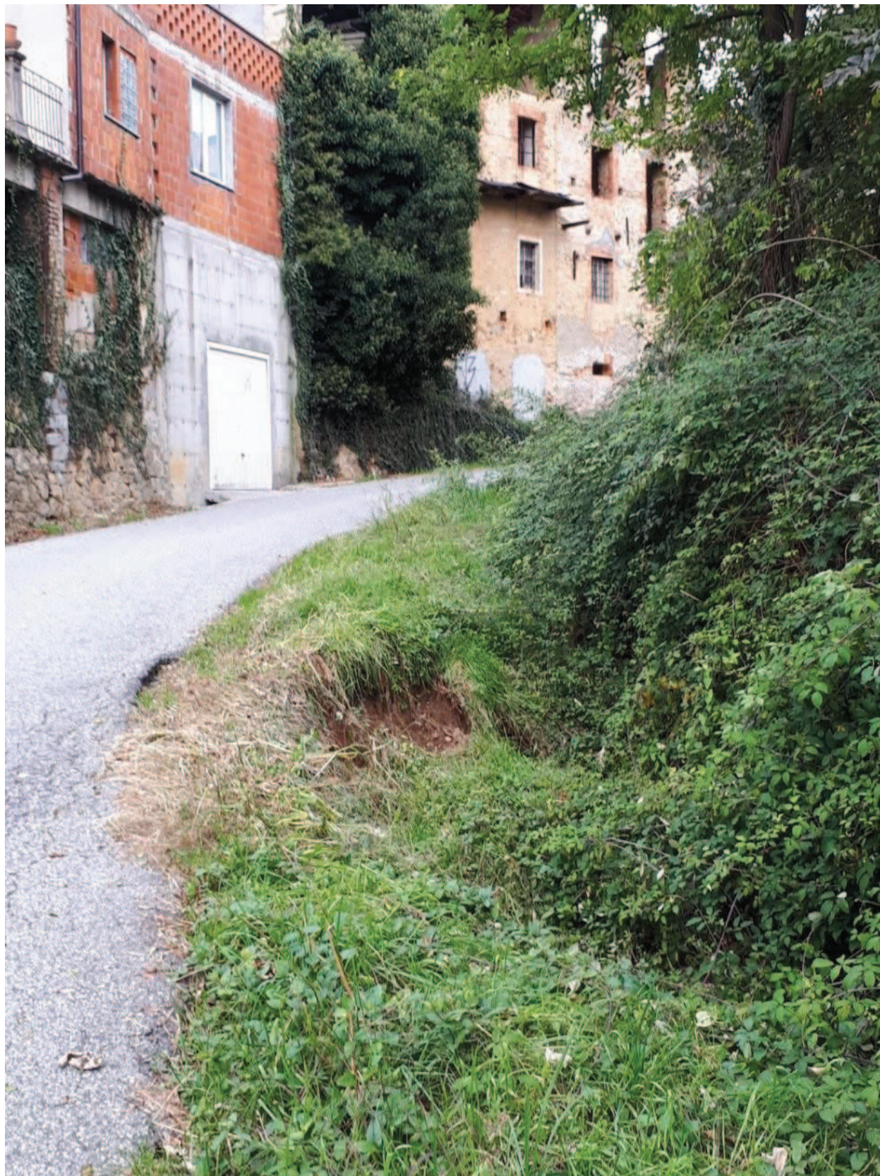
Cedimento di monte, nei pressi dell'abitato