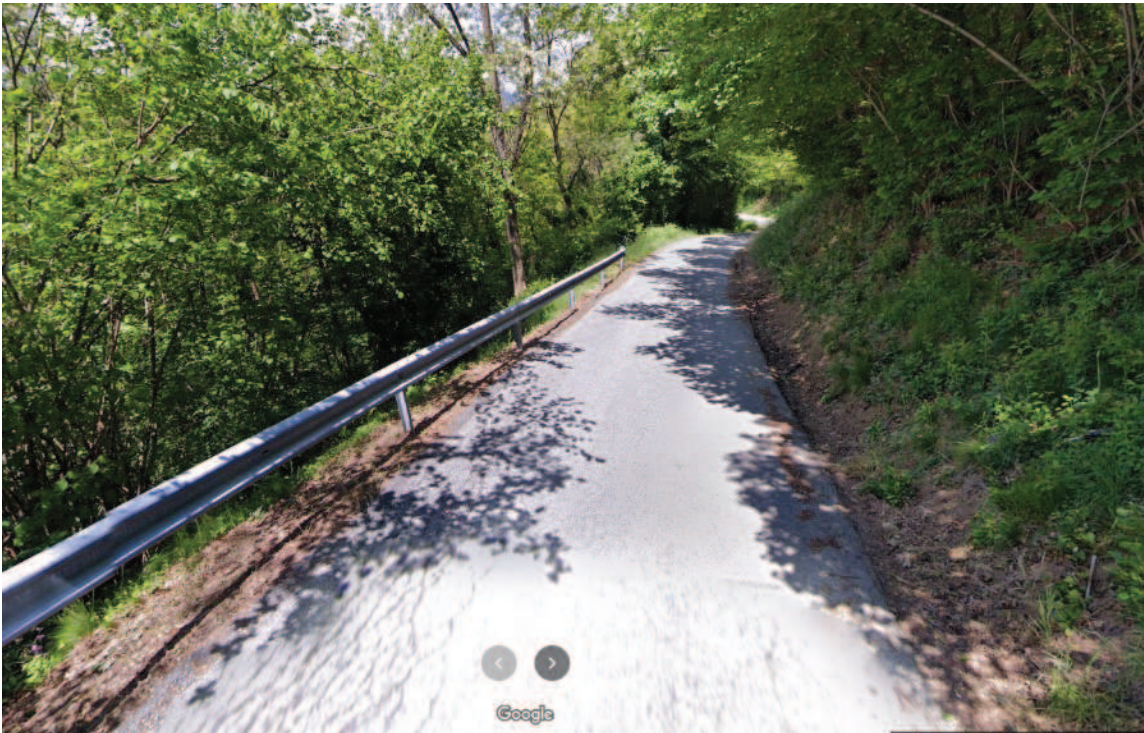
Area distacco smottamento ANTE evento