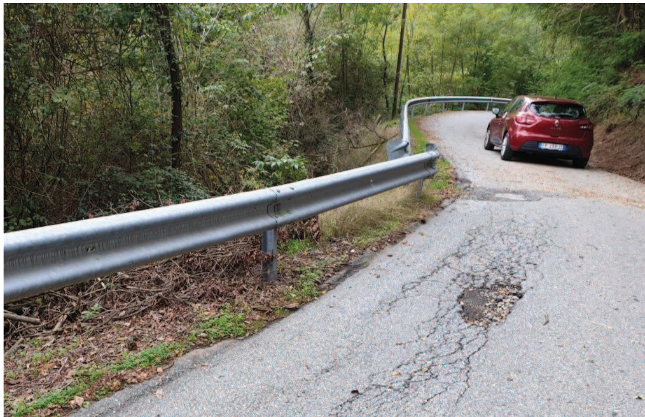
Ulteriori cedimenti viabilità