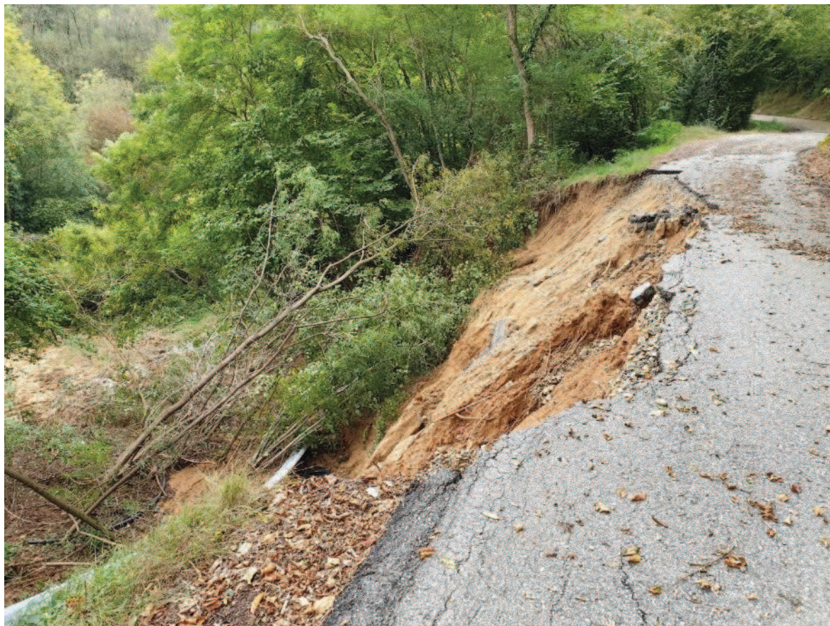
Area distacco smottamento POST evento