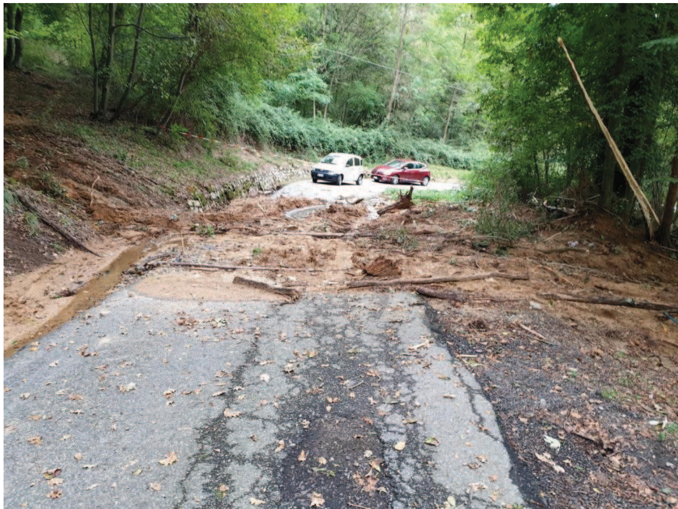
Viabilità inferiore POST evento