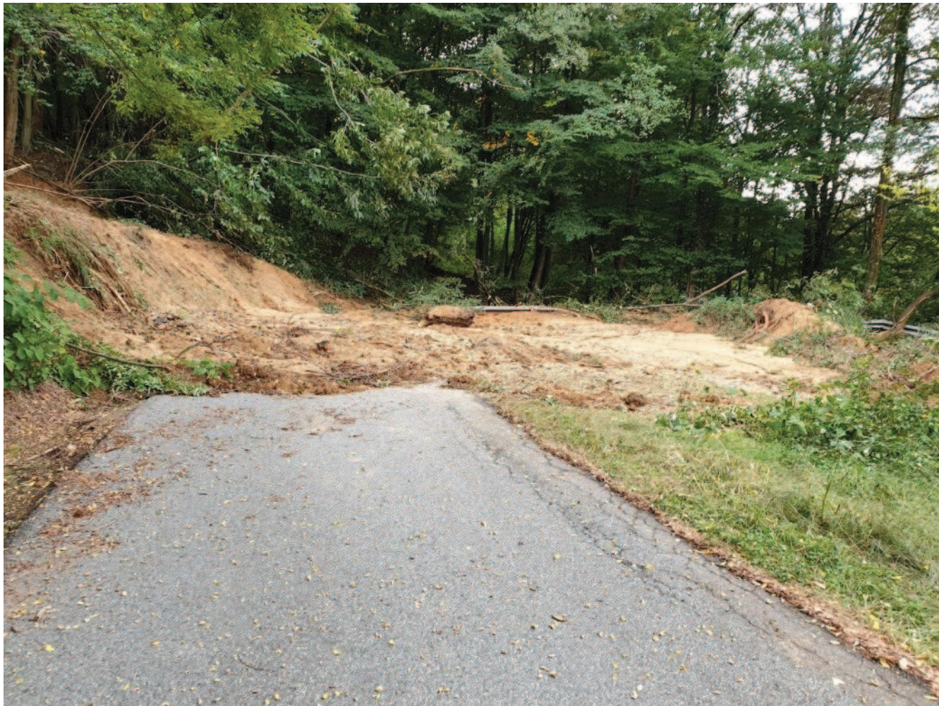
Tornante sottostante POST evento